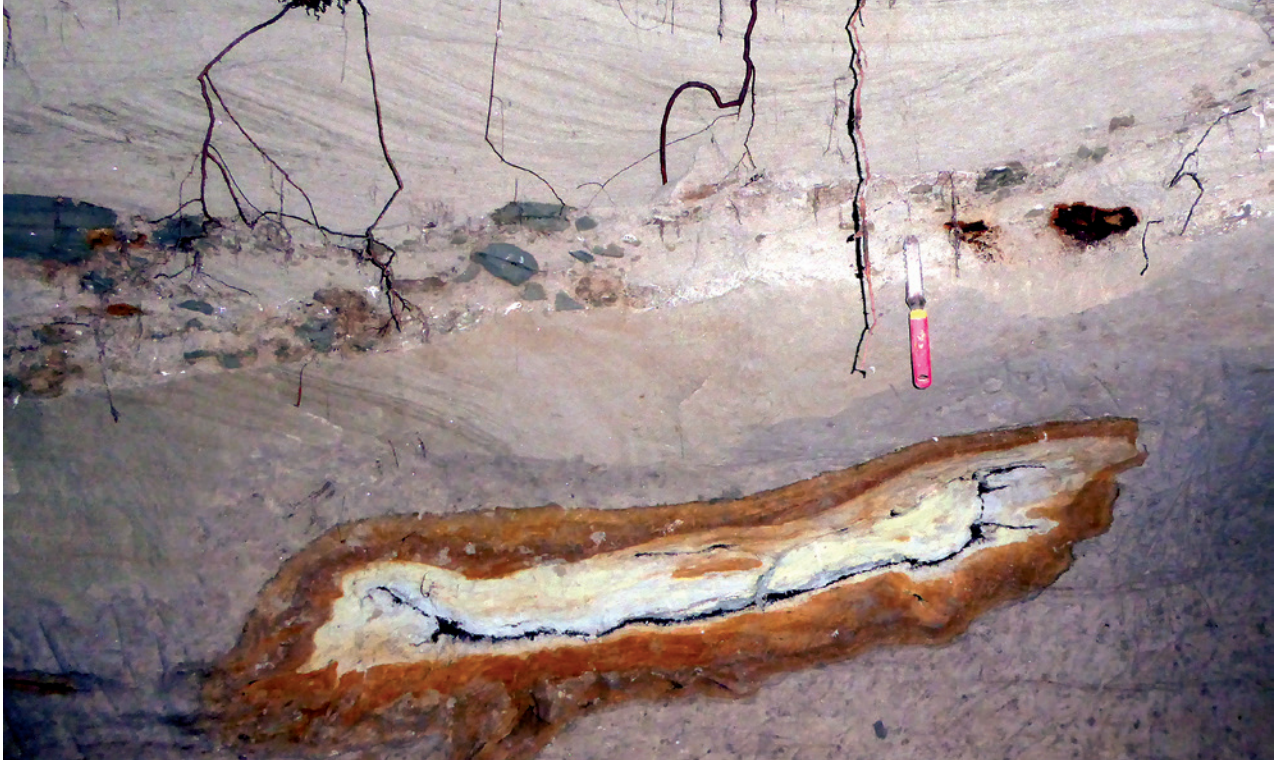
2: Westliche Innenwand des Weiler Sandkellers Nr. 3 mit dem Fundhorizont der Brachypotherium -Skelettelemente nahe der Kellerdecke. Länge des Hakenkratzers etwa 20 cm. In der Fundschicht zeigen sich (rechts des Hakenkratzers) zwei dunkle Knochenreste des Nashorns noch in Fundlage (Knochen links: Rippenfragment, Knochen rechts: Unterkieferast). Die Fundschicht, eine bis zu 0,4 Meter mächtige, fluviatile Aufarbeitungslage, enthält zahlreiche Ton-/Mergelgerölle und Schalenreste der Flussmuschel Margaritifera flabellata . Etwa 0,4 Meter unterhalb der Säugetier-Fundschicht ist ein großer Holzrest angeschnitten. Aufnahme: Februar 2017.

(Bier, Most, Äpfel, Kartoffeln, Rüben) in Handarbeit in die Böschung der „Sandhalde“ eingegraben wurden. Die heute meist aufgelassenen und dem Verfall preisgegebenen Sandkeller haben rechteckige Grundflächen von durchschnittlich etwa 5 x 4 Meter und Höhen von etwa 3 Metern. An den senkrechten Kellerwänden zeigen sich schräggeschichtete, fluviatile Quarzfeinsande mit geringmächtigen Aufarbeitungslagen der mittelmiozänen Oberen Süßwassermolasse. Die genauen Fundpunkte der Brachypotherium -Skelettelemente befinden sich an den Wänden der Sandkeller Nr. 3 und Nr. 6. Nur wenige Meter nordwestlich von diesen Sandkellern entfernt, nördlich der Sandhaldestraße, befanden sich früher weitere Keller und eine große Sandgrube, die zur Gewinnung von Baumaterial für die Basilika St. Martin in Weingarten angelegt worden war.