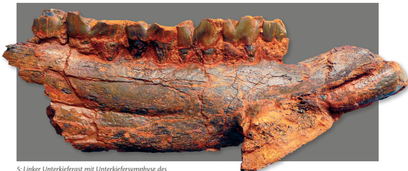
5: Linker Unterkieferast mit Unterkiefersymphyse des Kurzbein-Nashorns Brachypotherium brachypus (Lartet); linguale Ansicht. Weiler Sandkeller Nr. 3. Länge: 39 cm. Alle Fotos und Grafiken: V. J. Sach.