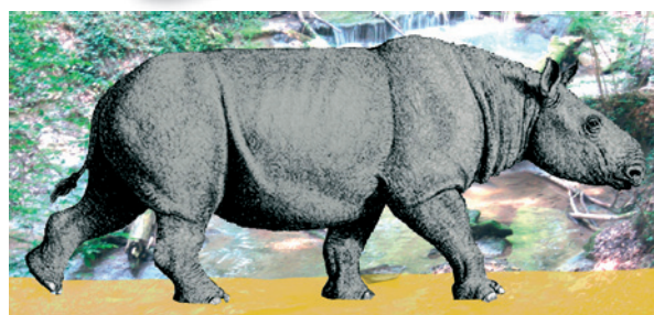
6: Lebensbild des Kurzbein-Nashorns Brachypotherium brachypus (Lartet). Verändert nach Internet-Vorlage.

Dorcatherium guntianum (Wassermoschustier), Amphimoschus pontileviensis (ein Wiederkäuer) sowie ein unbestimmter Paarhufer und ein Rüsseltier. Aufgrund der Zusammensetzung der Säugetierfauna und der Höhenlage der Fundstelle im Bezug zum nur vier Kilometer entfernten Vorkommen des Ries-Brockhorizonts, mit ortsfremden Gesteinsbrocken aus dem Jura und Strahlenkalken (Shatter-Cones), im Kleintobel bei Ravensburg (Sach 2014) kann dieser Fundkomplex biostratigraphisch in den Übergangsbereich der Säugerzonen MN 5/MN 6 (Mittelmiozän, jüngstes Orleanium bis ältestes Astaracium) eingestuft werden. Das absolute Alter der Weiler Brachypotherium -Funde beträgt damit ungefähr 15 Millionen Jahre.